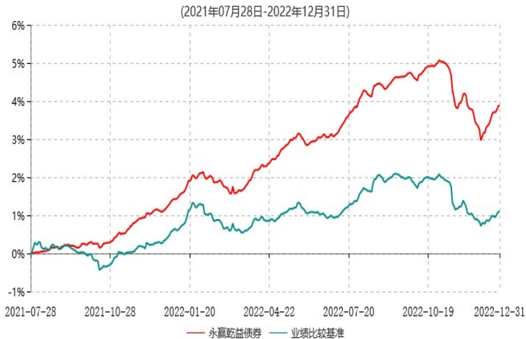
永赢乾益债券型证券投资基金累计净值增长率与业绩比较基准收益率历史走势对比图