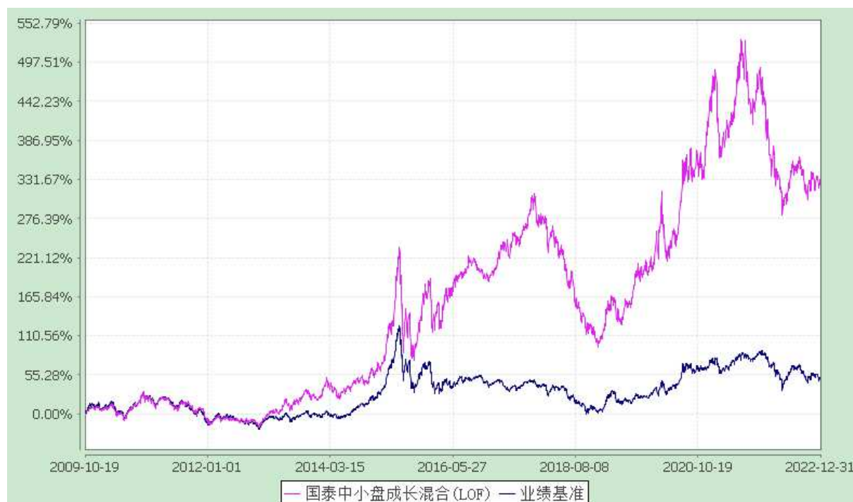
自基金合同生效以来份额累计净值增长率与业绩比较基准收益率的历史走势对比图 (2009 年 10 月 19 日至 2022 年 12 月 31 日)

注：本基金的转型日为 2009 年 10 月 19 日。本基金在六个月建仓期结束时，各项资产配置比例符合合同约定。