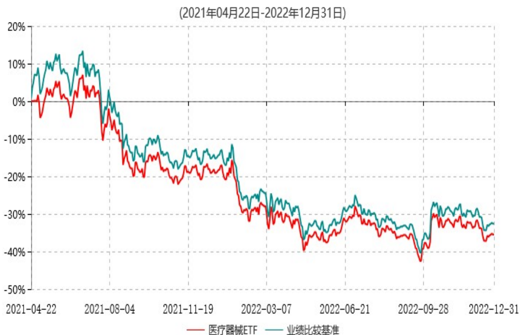
永赢中证全指医疗器械交易型开放式指数证券投资基金累计净值增长率与业绩比较基准收益率历史走势对比图