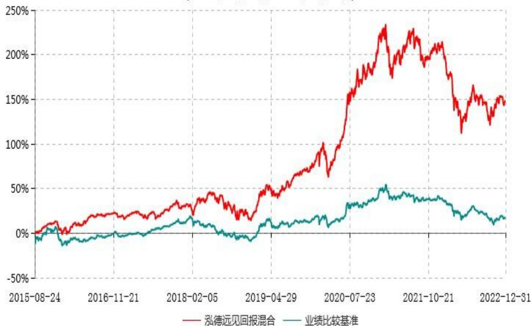
泓德远见回报混合型证券投资基金累计净值增长率与业绩比较基准收益率历史走势对比图 (2015年08月24日-2022年12月31日)

注：根据基金合同的约定，本基金建仓期为6个月，截至报告期末，本基金的各项投资比例符合基金合同关于投资范围及投资限制规定。