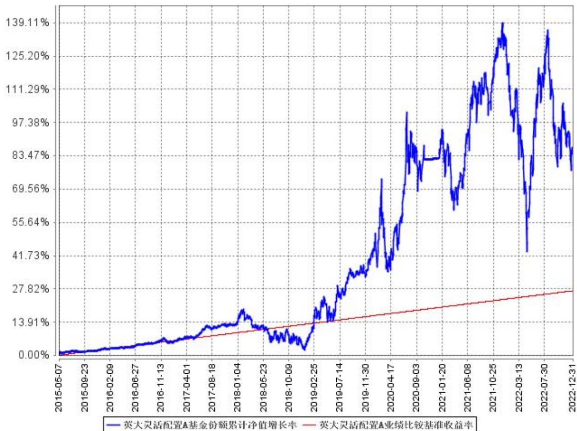
英大灵活配置A基金份额累计净值增长率与同期业绩比较基准收益率的历史走势对比图