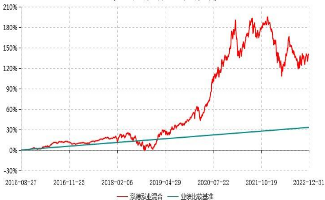
泓德泓业灵活配置混合型证券投资基金累计净值增长率与业绩比较基准收益率历史走势对比图 (2015年08月27日-2022年12月31日)

注：根据基金合同的约定，本基金建仓期为6个月，截至报告期末，本基金的各项投资比例符合基金合同关于投资范围及投资限制规定。