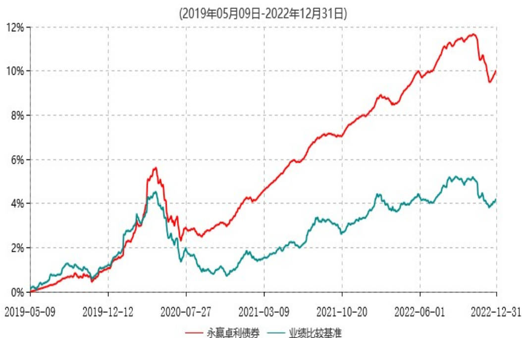
永赢卓利债券型证券投资基金累计净值增长率与业绩比较基准收益率历史走势对比图