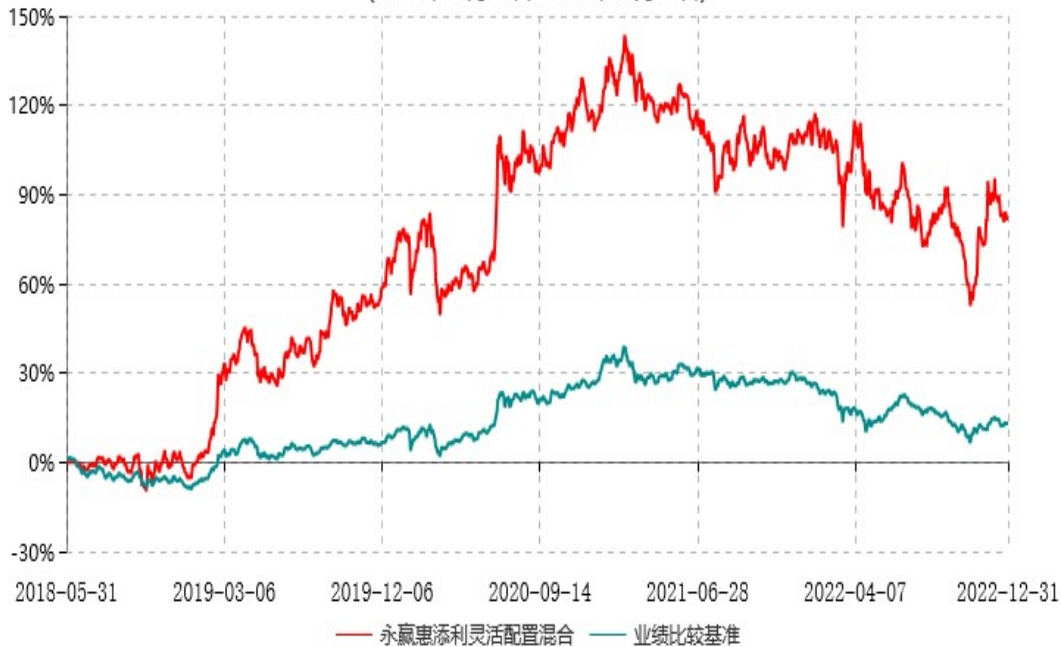
永赢惠添利灵活配置混合型证券投资基金累计净值增长率与业绩比较基准收益率历史走势对比图 (2018年05月31日-2022年12月31日)