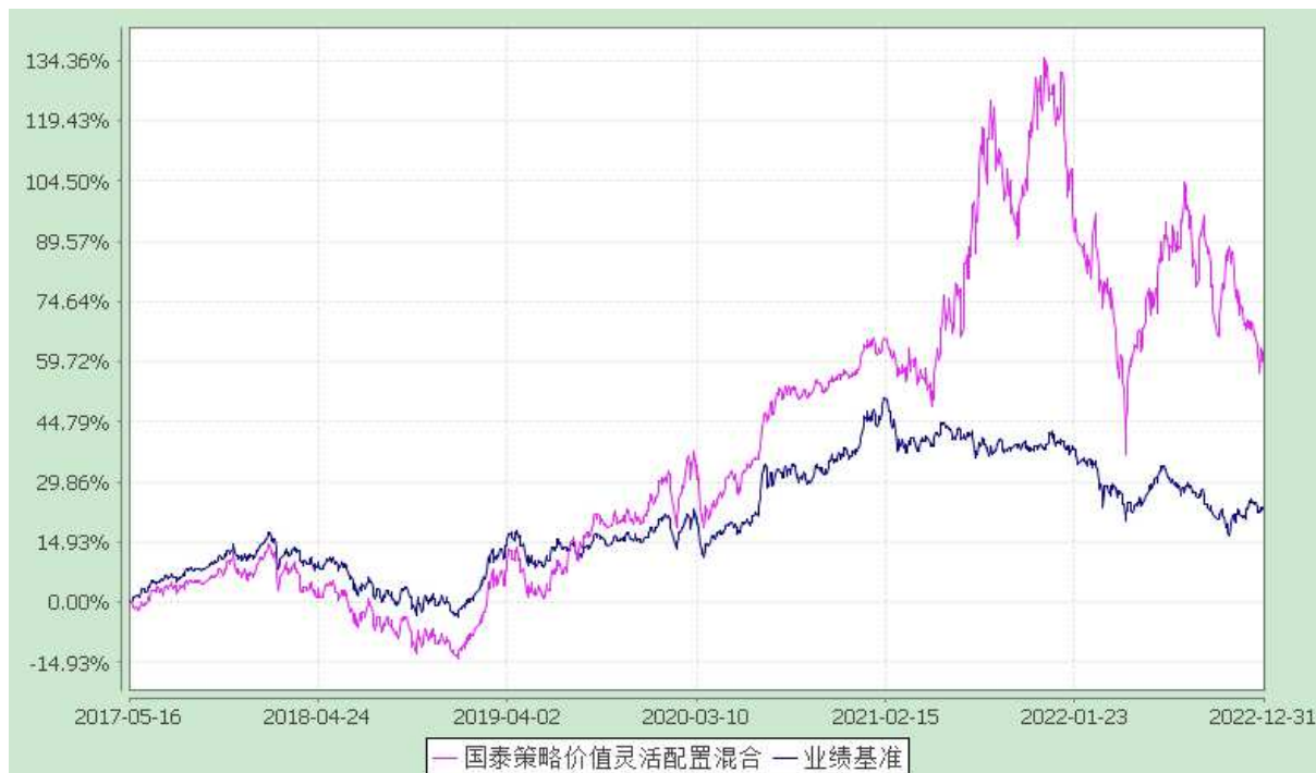
自基金合同生效以来份额累计净值增长率与业绩比较基准收益率的历史走势对比图 (2017 年 5 月 16 日至 2022 年 12 月 31 日)

注：本基金合同生效日为 2017 年 5 月 16 日。本基金在 3 个月建仓结束时，各项资产配置比例符合合同约定。