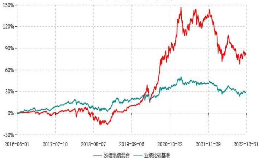
泓德泓信灵活配置混合型证券投资基金累计净值增长率与业绩比较基准收益率历史走势对比图 (2016年06月01日-2022年12月31日)

注：根据基金合同的约定，本基金建仓期为6个月，截至报告期末，本基金的各项投资比例符合基金合同关于投资范围及投资限制规定。