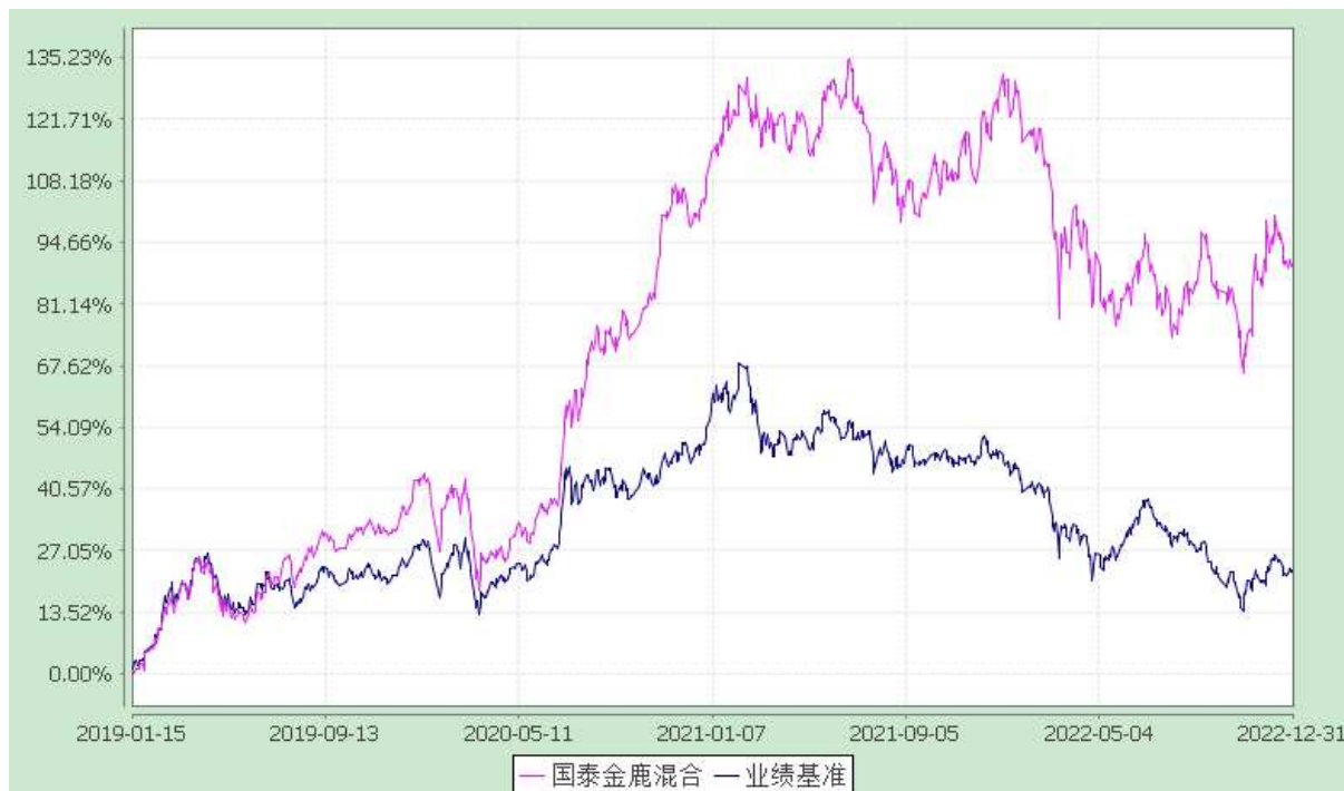
自基金合同生效以来份额累计净值增长率与业绩比较基准收益率的历史走势对比图 (2019 年 1 月 15 日至 2022 年 12 月 31 日)

注：本基金合同生效日为 2019 年 1 月 15 日，在六个月建仓期结束时，各项资产配置比例符合合同约定。