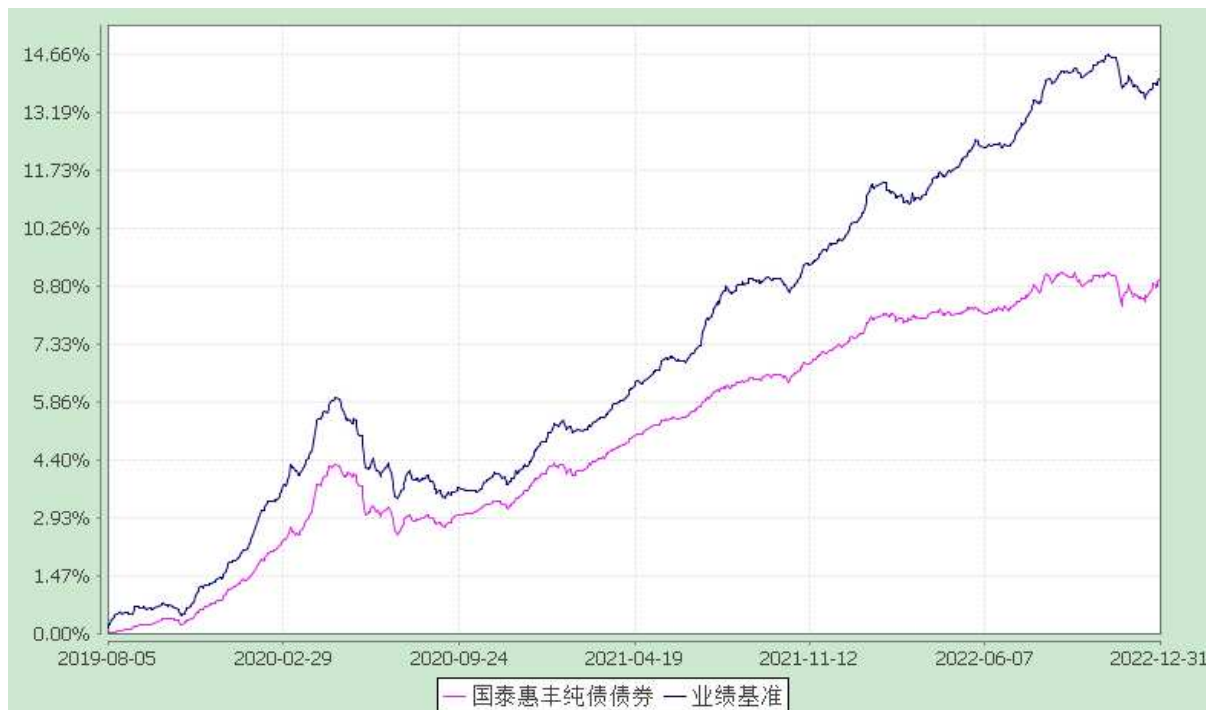
自基金合同生效以来份额累计净值增长率与业绩比较基准收益率的历史走势对比图 (2019 年 8 月 5 日至 2022 年 12 月 31 日)

注：本基金合同生效日为 2019 年 8 月 5 日，在六个月建仓期结束时，各项资产配置比例符合合同约定。