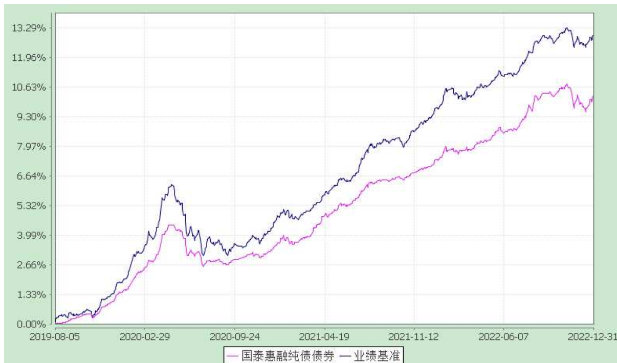
自基金合同生效以来份额累计净值增长率与业绩比较基准收益率的历史走势对比图 (2019 年 8 月 5 日至 2022 年 12 月 31 日)

注：本基金合同生效日为 2019 年 8 月 5 日，在六个月建仓期结束时，各项资产配置比例符合合同约定。