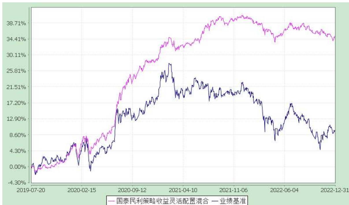
自基金合同生效以来份额累计净值增长率与业绩比较基准收益率的历史走势对比图 (2019 年 7 月 20 日至 2022 年 12 月 31 日)