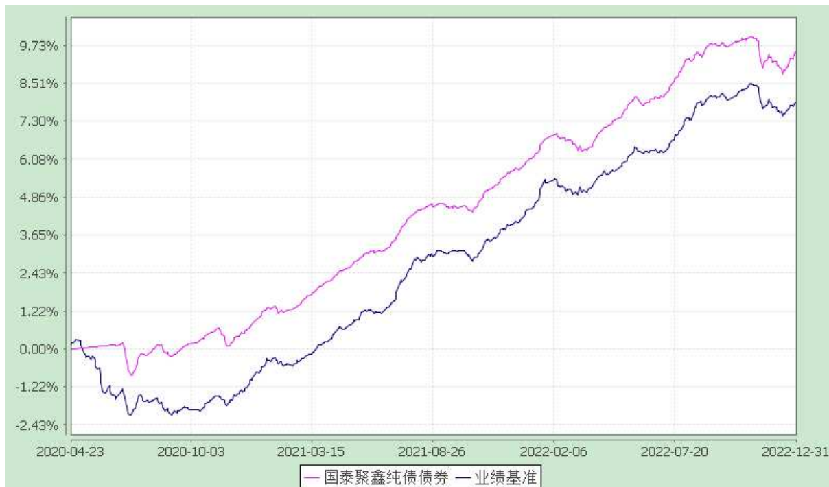
自基金合同生效以来份额累计净值增长率与业绩比较基准收益率的历史走势对比图 (2020 年 4 月 23 日至 2022 年 12 月 31 日)

注：本基金合同生效日为 2020 年 4 月 23 日。本基金在六个月建仓期结束时，各项资产配置比例符合合同约定。