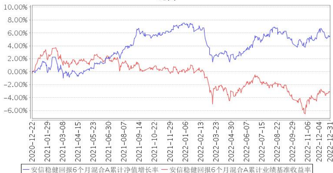
安信稳健回报6个月混合A累计净值增长率与同期业绩比较基准收益率的历史走势对比图