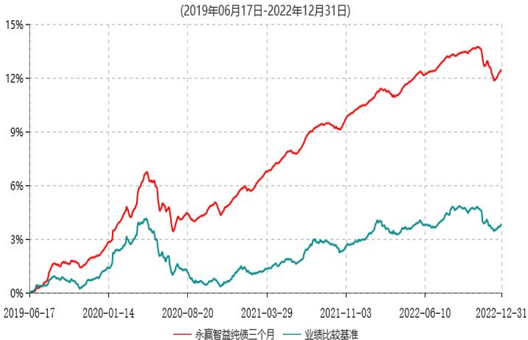
永赢智益纯债三个月定期开放债券型发起式证券投资基金累计净值增长率与业绩比较基准收益率历史走势对比图