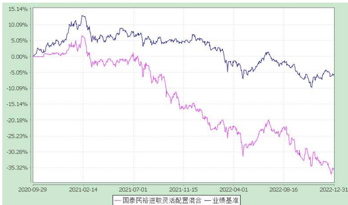
自基金合同生效以来份额累计净值增长率与业绩比较基准收益率的历史走势对比图 (2020 年 9 月 29 日至 2022 年 12 月 31 日)

注：本基金合同生效日为 2020 年 9 月 29 日，本基金在六个月建仓期结束时，各项资产配置比例符合合同约定。