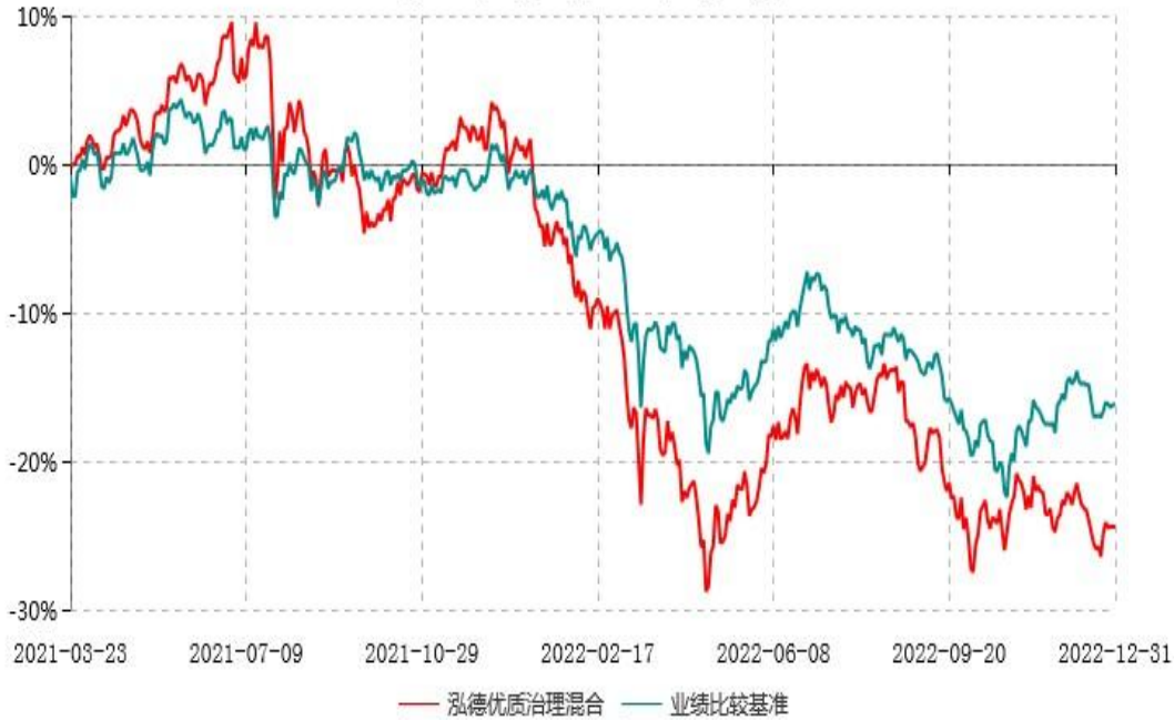
泓德优质治理灵活配置混合型证券投资基金累计净值增长率与业绩比较基准收益率历史走势对比图 (2021年03月23日-2022年12月31日)

注：根据基金合同的约定，本基金建仓期为6个月，截至报告期末，本基金的各项投资比例符合基金合同关于投资范围及投资限制规定。