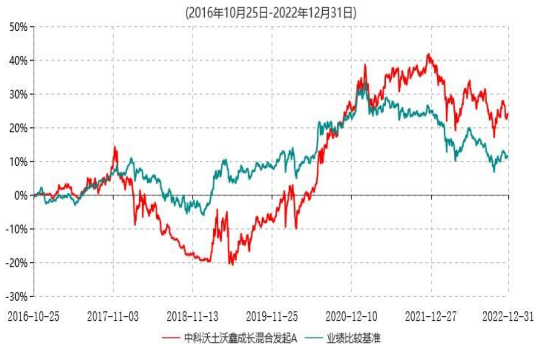
中科沃土沃鑫成长混合发起A累计净值增长率与业绩比较基准收益率历史走势对比图