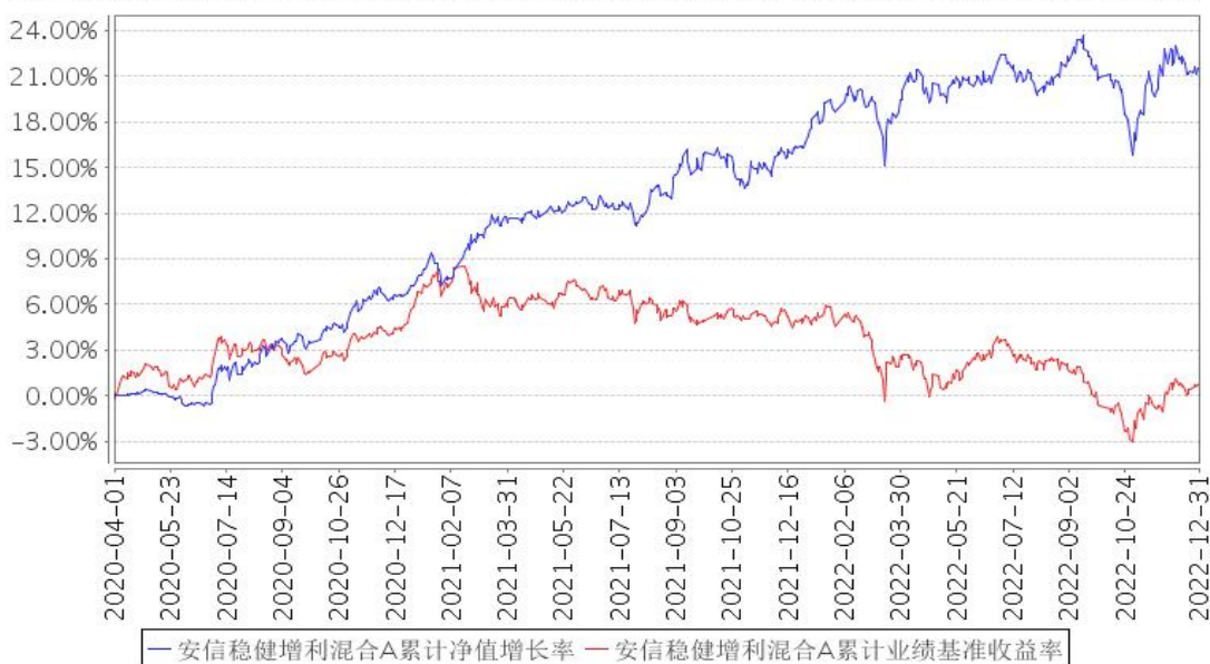
安信稳健增利混合A累计净值增长率与同期业绩比较基准收益率的历史走势对比图