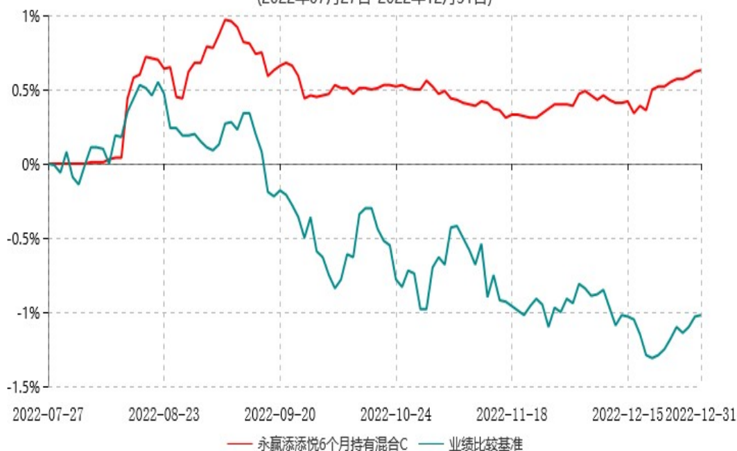
永赢添悦6个月持有混合C累计净值增长率与业绩比较基准收益率历史走势对比图 (2022年07月27日-2022年12月31日)