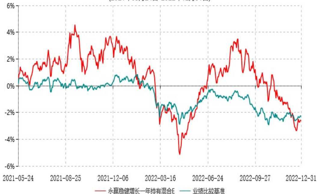
永赢稳健增长一年持有混合E累计净值增长率与业绩比较基准收益率历史走势对比图 (2021年05月24日-2022年12月31日)