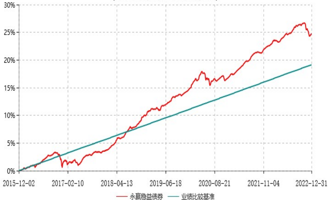
永赢稳益债券型证券投资基金累计净值增长率与业绩比较基准收益率历史走势对比图 (2015年12月02日-2022年12月31日)