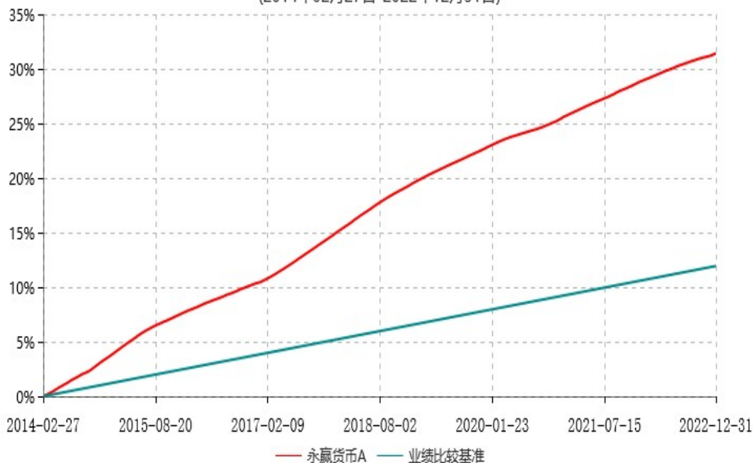
永赢货币A累计净值收益率与业绩比较基准收益率历史走势对比图 (2014年02月27日-2022年12月31日)