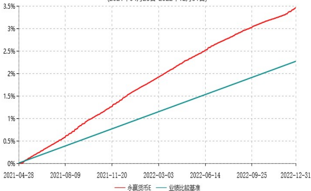
永赢货币E累计净值收益率与业绩比较基准收益率历史走势对比图 (2021年04月28日-2022年12月31日)