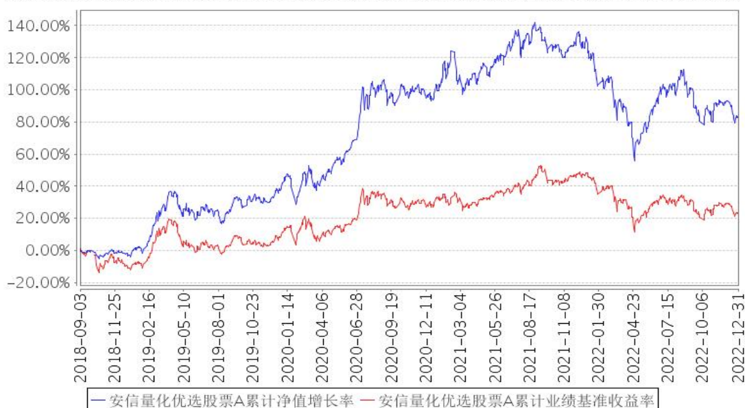
安信量化优选股票A累计净值增长率与同期业绩比较基准收益率的历史走势对比图