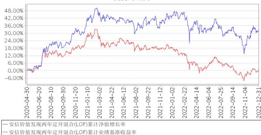
安信价值发现两年定开混合(LOF)累计净值增长率与同期业绩比较基准收益率的历史走势对比图