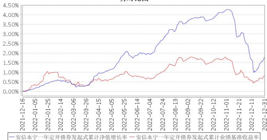
安信永宁一年定开债券发起式累计净值增长率与同期业绩比较基准收益率的历史走势对比图