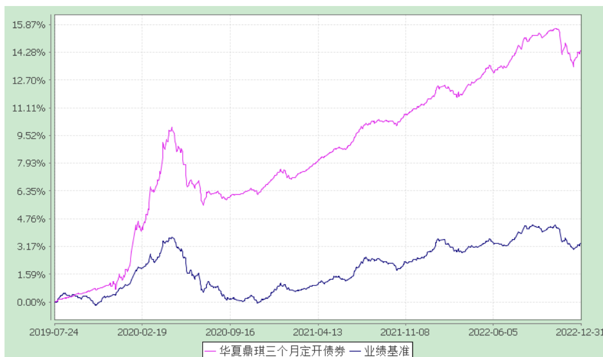
华夏鼎琪三个月定期开放债券型发起式证券投资基金 份额累计净值增长率与业绩比较基准收益率历史走势对比图 (2019年7月24日至2022年12月31日)