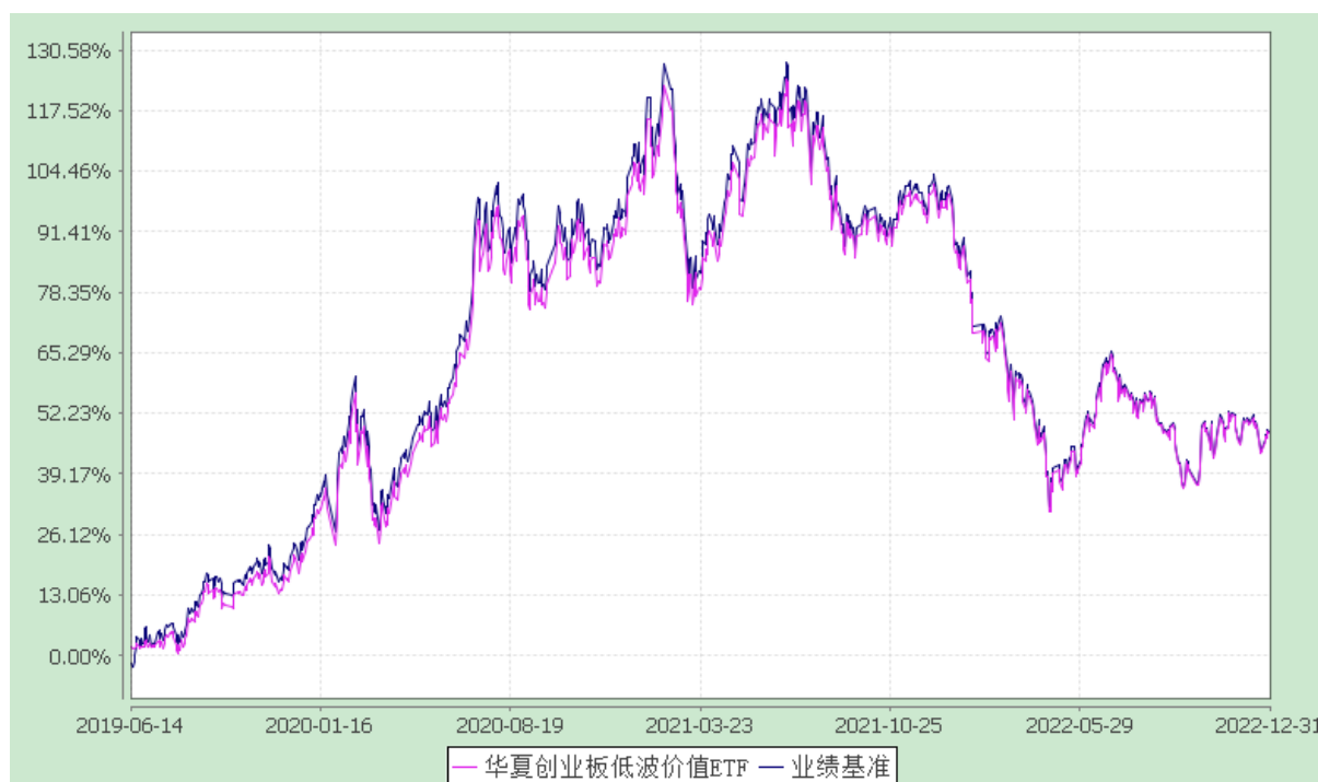
华夏创业板低波蓝筹交易型开放式指数证券投资基金 份额累计净值增长率与业绩比较基准收益率历史走势对比图 (2019年6月14日至2022年12月31日)