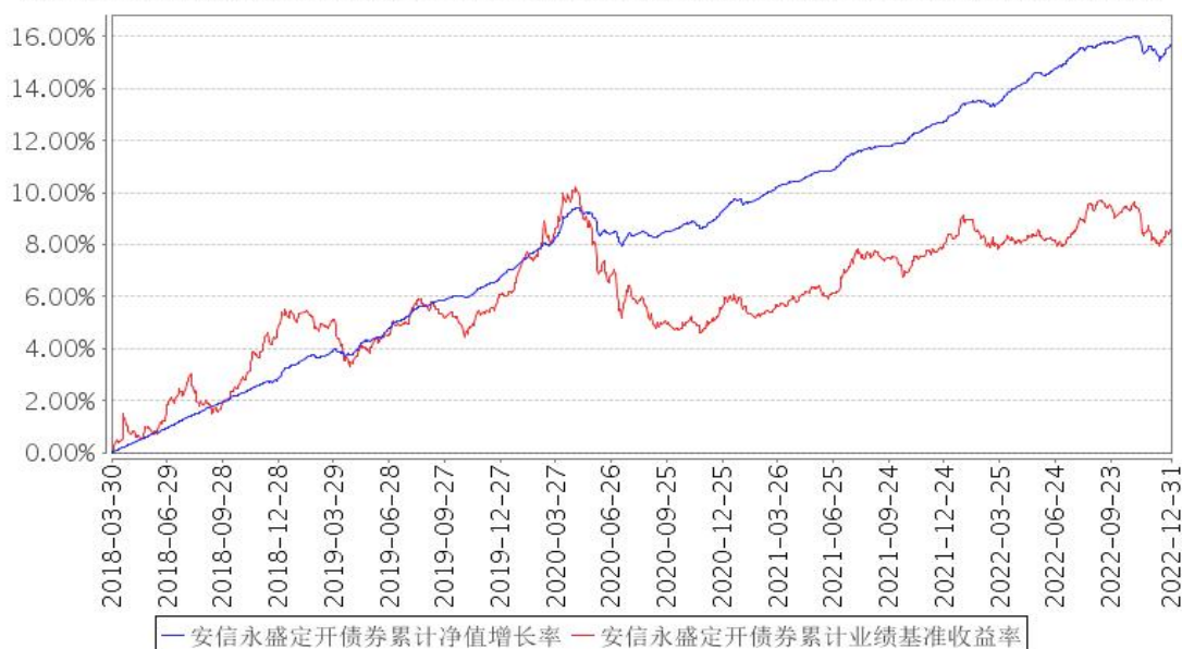
安信永盛定开债券累计净值增长率与同期业绩比较基准收益率的历史走势对比图