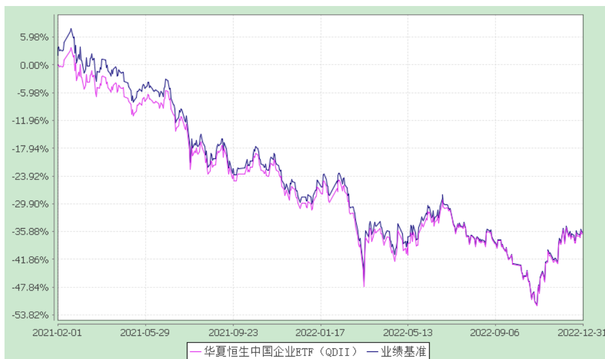
华夏恒生中国企业交易型开放式指数证券投资基金（QDII） 基金份额累计净值增长率与业绩比较基准收益率的历史走势对比图 (2021年2月1日至2022年12月31日)