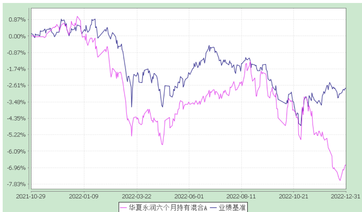
华夏永润六个月持有混合 C