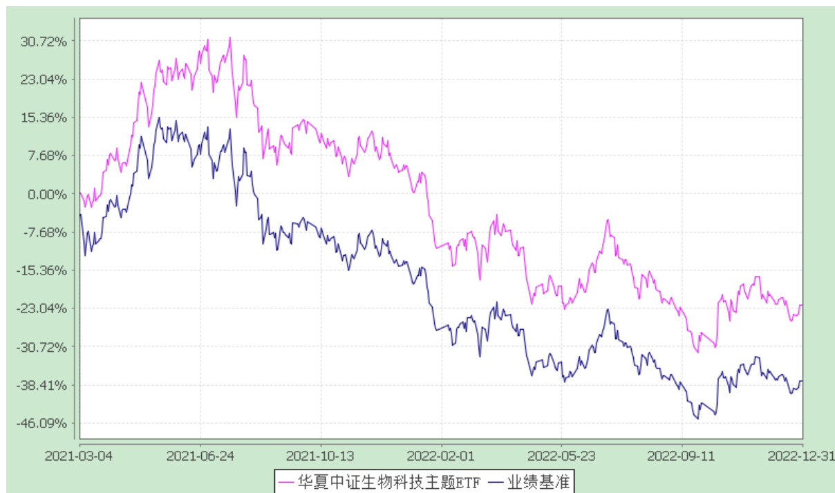
华夏中证生物科技主题交易型开放式指数证券投资基金 份额累计净值增长率与业绩比较基准收益率历史走势对比图 (2021年3月4日至2022年12月31日)