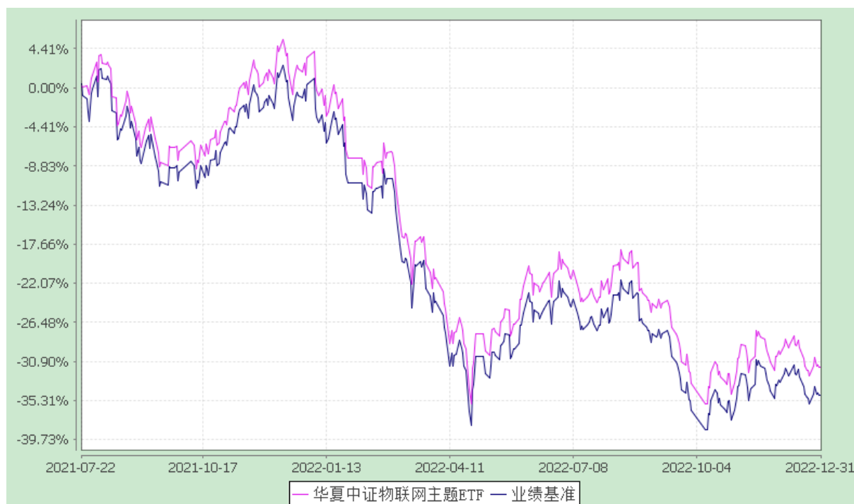
华夏中证物联网主题交易型开放式指数证券投资基金 份额累计净值增长率与业绩比较基准收益率历史走势对比图 (2021 年 7 月 22 日至 2022 年 12 月 31 日)

注：根据本基金的基金合同规定，本基金自基金合同生效之日起 6 个月内使基金的投资组合比例符合本基金合同中投资范围、投资限制的有关约定。