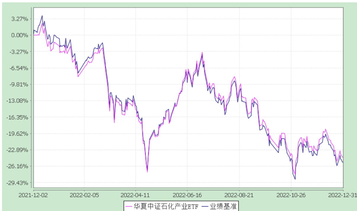
华夏中证石化产业交易型开放式指数证券投资基金 份额累计净值增长率与业绩比较基准收益率历史走势对比图 (2021 年 12 月 2 日至 2022 年 12 月 31 日)

注：根据本基金的基金合同规定，本基金自基金合同生效之日起 6 个月内使基金的投资组合比例符合本基金合同中投资范围、投资限制的有关约定。