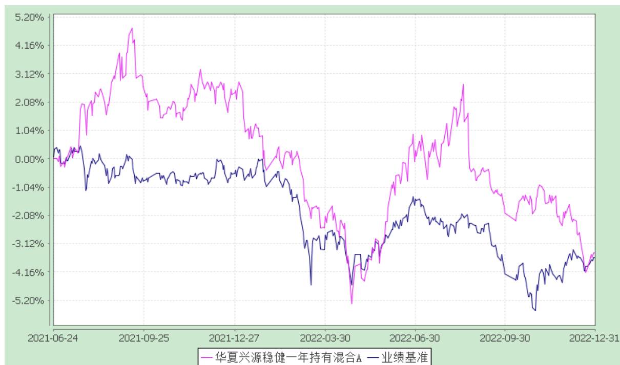
华夏兴源稳健一年持有混合 C