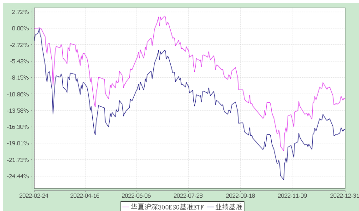
华夏沪深 300ESG 基准交易型开放式指数证券投资基金 份额累计净值增长率与业绩比较基准收益率历史走势对比图 (2022 年 2 月 24 日至 2022 年 12 月 31 日)