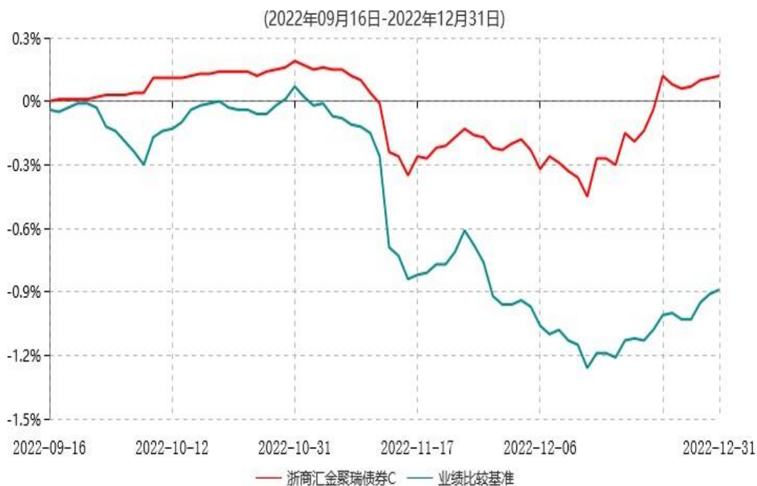
浙商汇金聚瑞债券C累计净值增长率与业绩比较基准收益率历史走势对比图