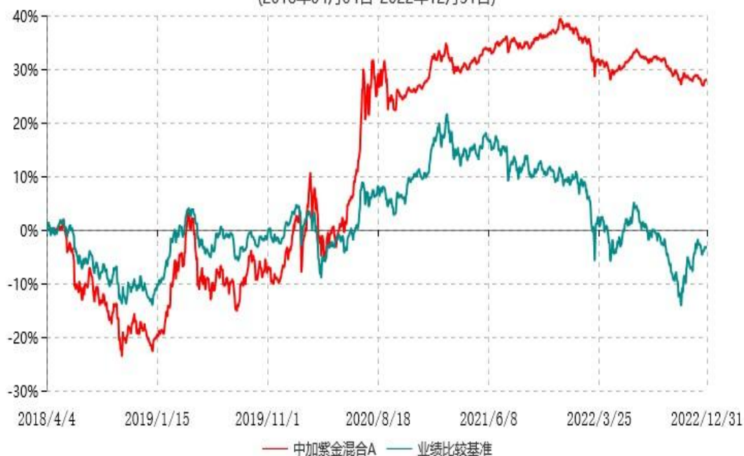
中加紫金混合C累计净值增长率与业绩比较基准收益率历史走势对比图