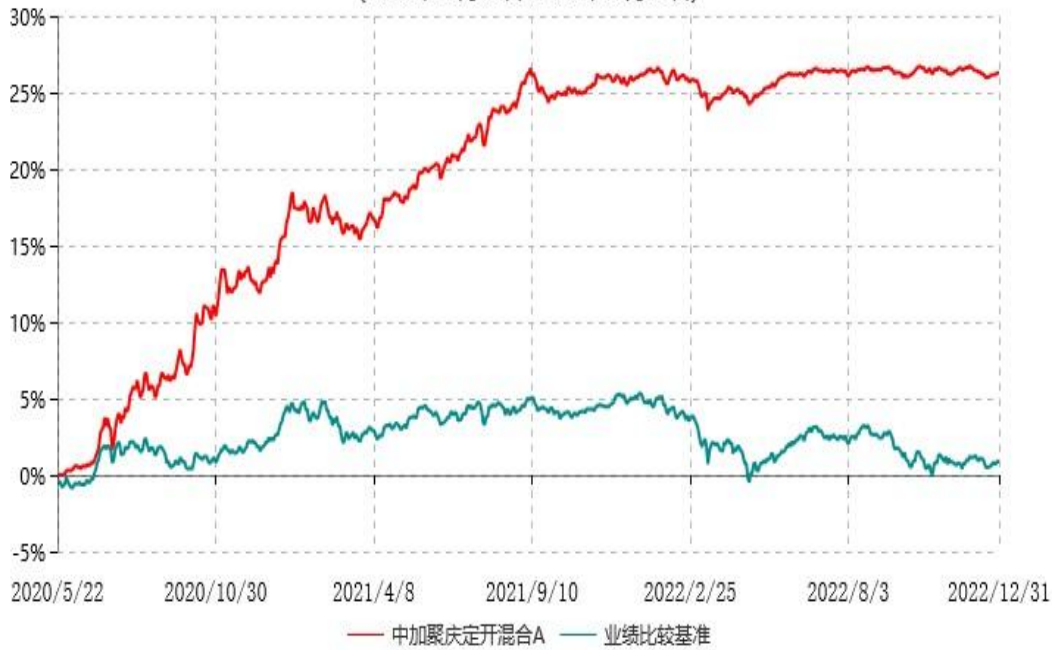
中加聚庆定开混合C累计净值增长率与业绩比较基准收益率历史走势对比图