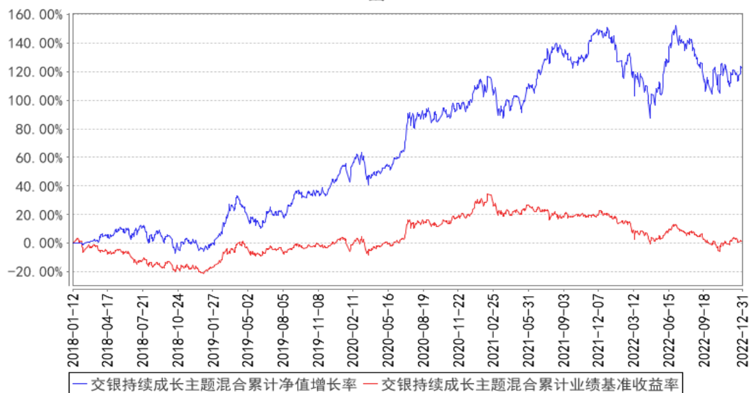
交银持续成长主题混合累计净值增长率与同期业绩比较基准收益率的历史走势对比图

注：本基金建仓期为自基金合同生效日起的 6 个月。截至建仓期结束，本基金各项资产配置比例符合基金合同及招募说明书有关投资比例的约定。