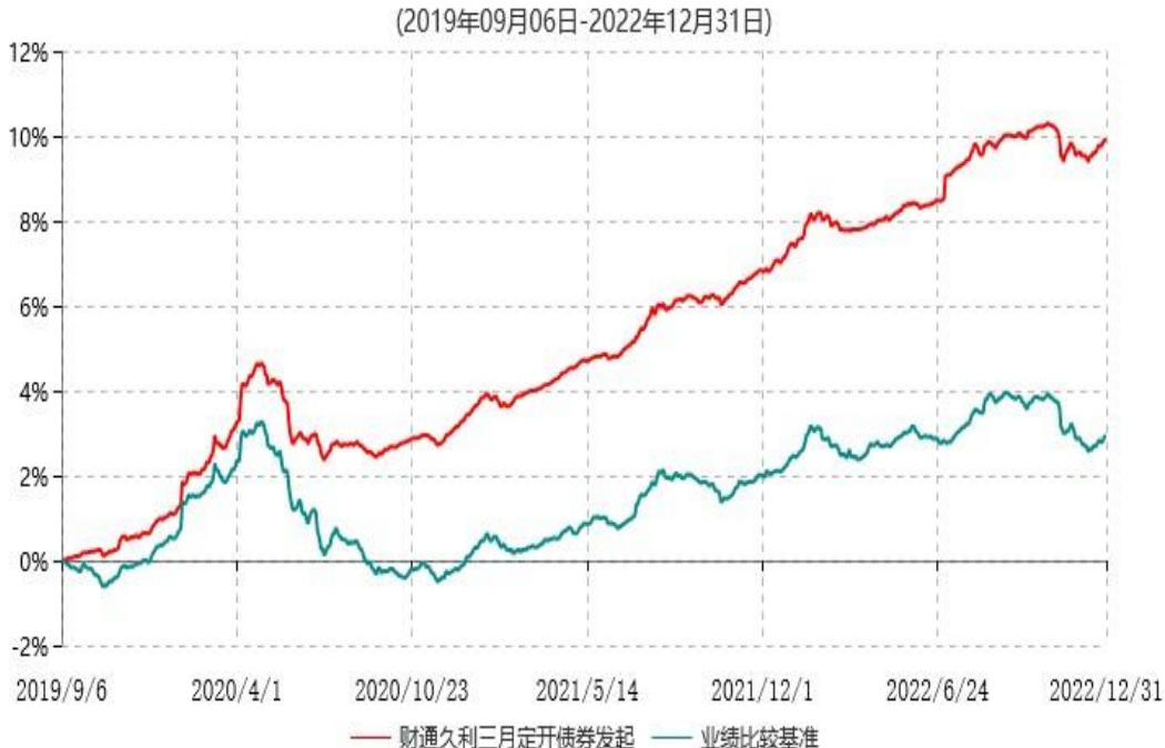
财通久利三个月定期开放债券型发起式证券投资基金累计净值增长率与业绩比较基准收益率历史走势对比图