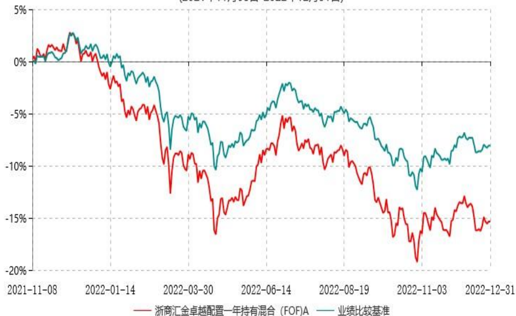
浙商汇金卓越配置一年持有混合（FOF）A累计净值增长率与业绩比较基准收益率历史走势对比图 (2021年11月08日-2022年12月31日)

注：自2021年11月08日起，《浙商汇金卓越配置一年持有期混合型基金中基金（FOF）基金合同》生效，《浙商汇金1号集合资产管理合同》同时失效，浙商汇金1号集合资产管理计划正式变更为浙商汇金卓越配置一年持有期混合型基金中基金（FOF）。至本报告期末，本基金已完成建仓，但报告期末距建仓结束不满一年，建仓期为2021年11月08日-2022年05月07日，本基金建仓期结束时各项资产配置比例符合合同的约定。