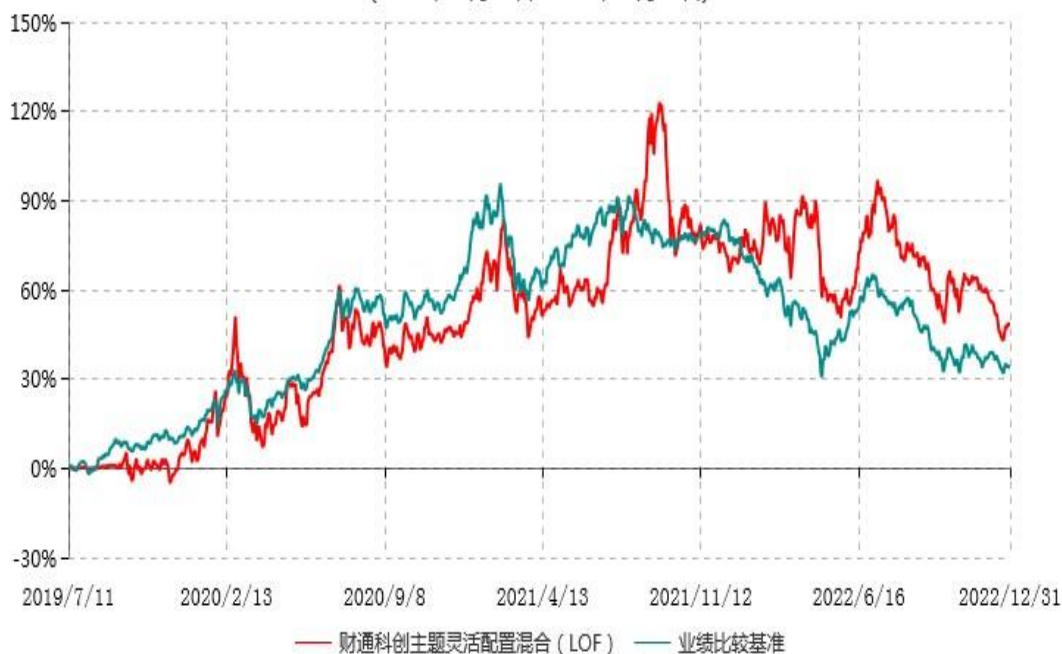
财通科创主题灵活配置混合型证券投资基金（LOF）累计净值增长率与业绩比较基准收益率历史走势对比图 (2019年07月11日-2022年12月31日)