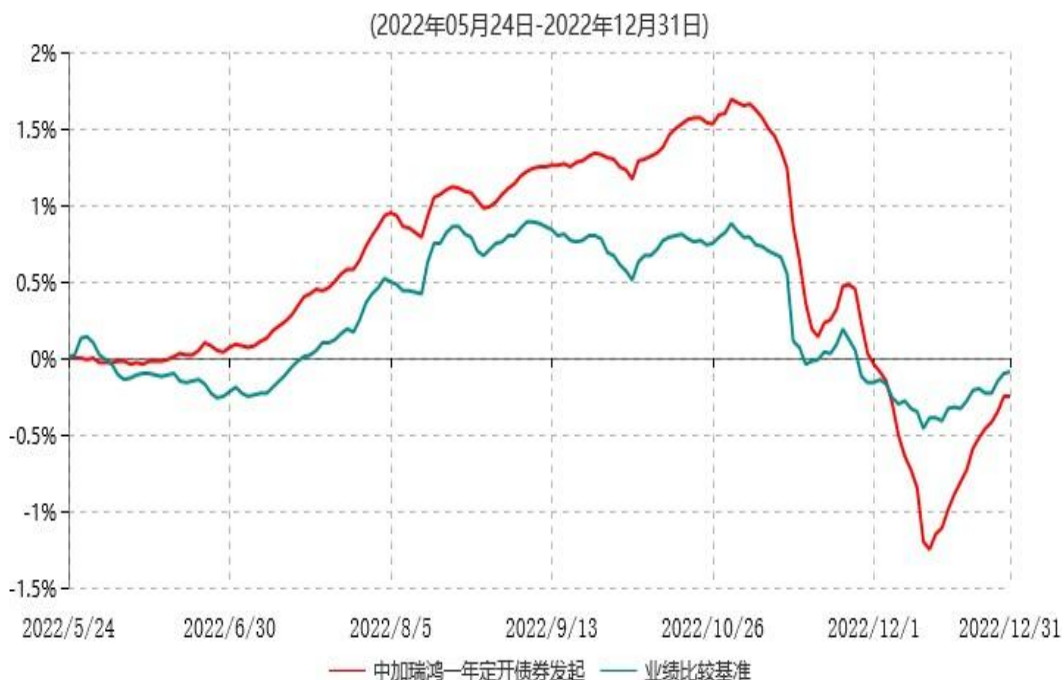
中加瑞鸿一年定期开放债券型发起式证券投资基金累计净值增长率与业绩比较基准收益率历史走势对比图

注：1.本基金基金合同于2022年5月24日生效，截至本报告期末，本基金基金合同生效未 满一年。