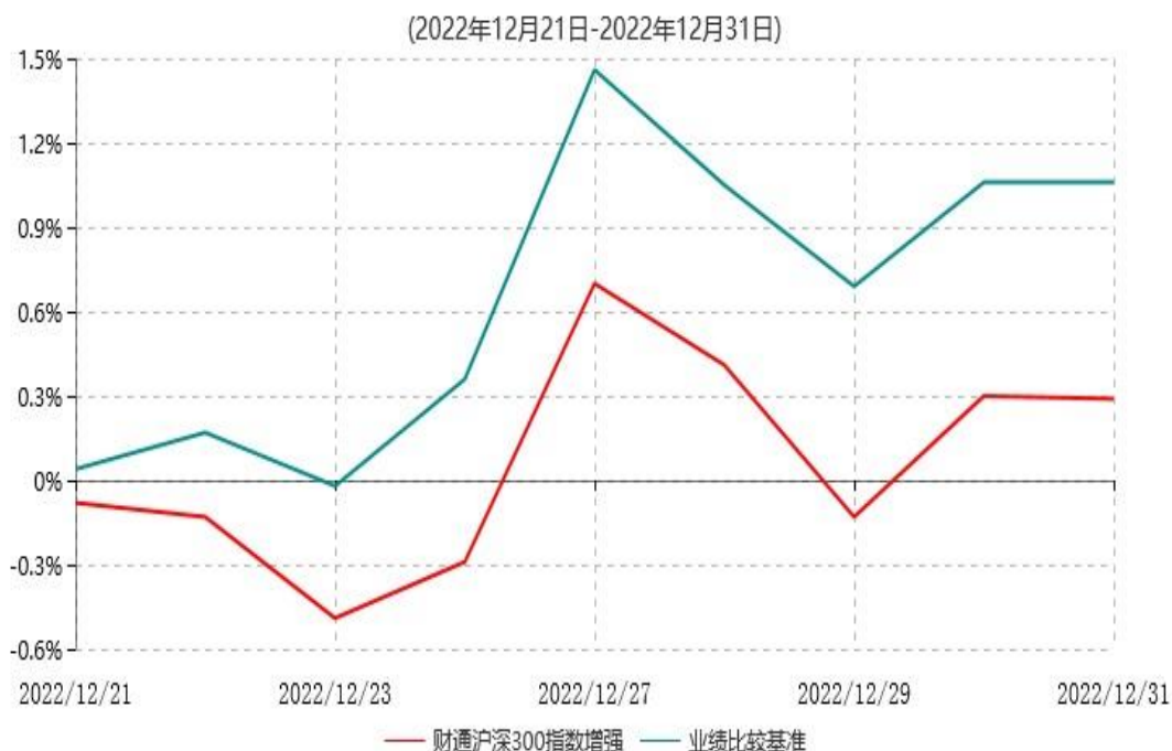
财通沪深300指数增强型证券投资基金累计净值增长率与业绩比较基准收益率历史走势对比图

注：(1)根据本基金基金份额持有人大会表决结果，本基金自2022年12月21日起转型为财通沪深300指数增强型证券投资基金，基金转型日至披露时点不满一年；