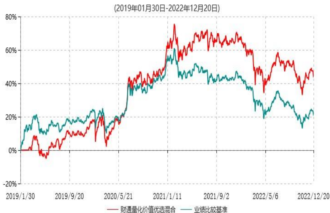
财通量化价值优选混合累计净值增长率与业绩比较基准收益率历史走势对比图

注：(1)本基金合同生效日为2019年01月30日，转型日期为2022年12月21日； (2)本基金建仓期是合同生效日起6个月，截至本报告期末，本基金的资产配置符合基金契约的相关要求。