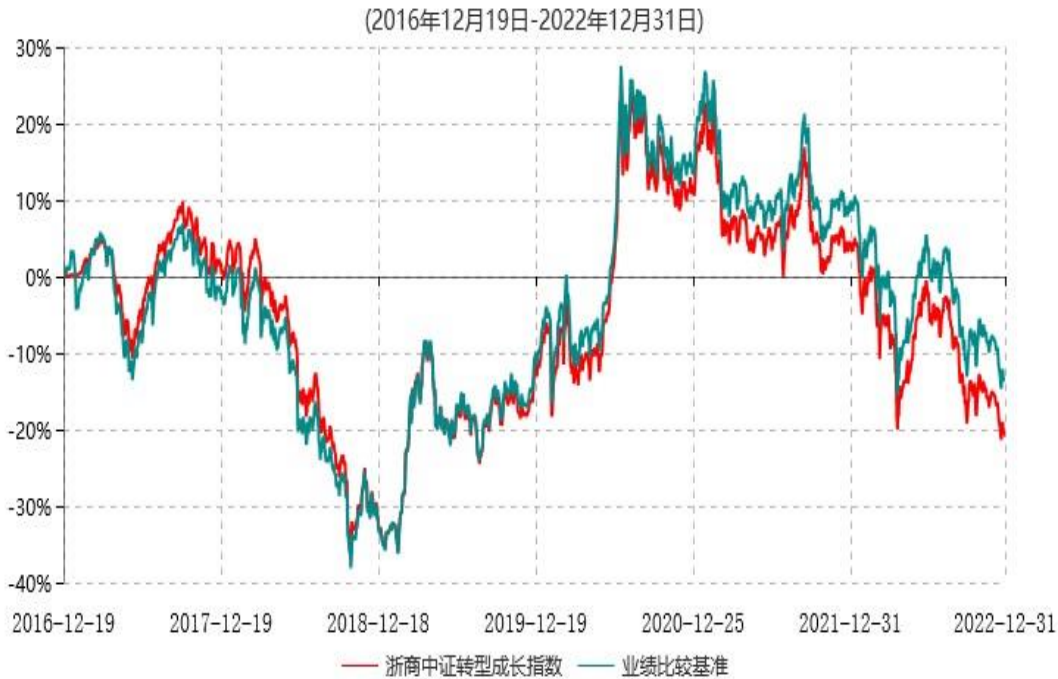
浙商汇金中证转型成长指数型证券投资基金累计净值增长率与业绩比较基准收益率历史走势对比图