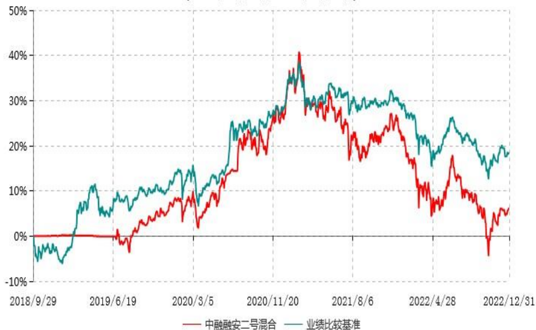
中融融安二号灵活配置混合型证券投资基金累计净值增长率与业绩比较基准收益率历史走势对比图 (2018年09月29日-2022年12月31日)

注：按基金合同和招募说明书的约定，本基金自基金合同生效日起6个月内为建仓期，建仓期结束时本基金的各项投资比例符合基金合同的有关约定。