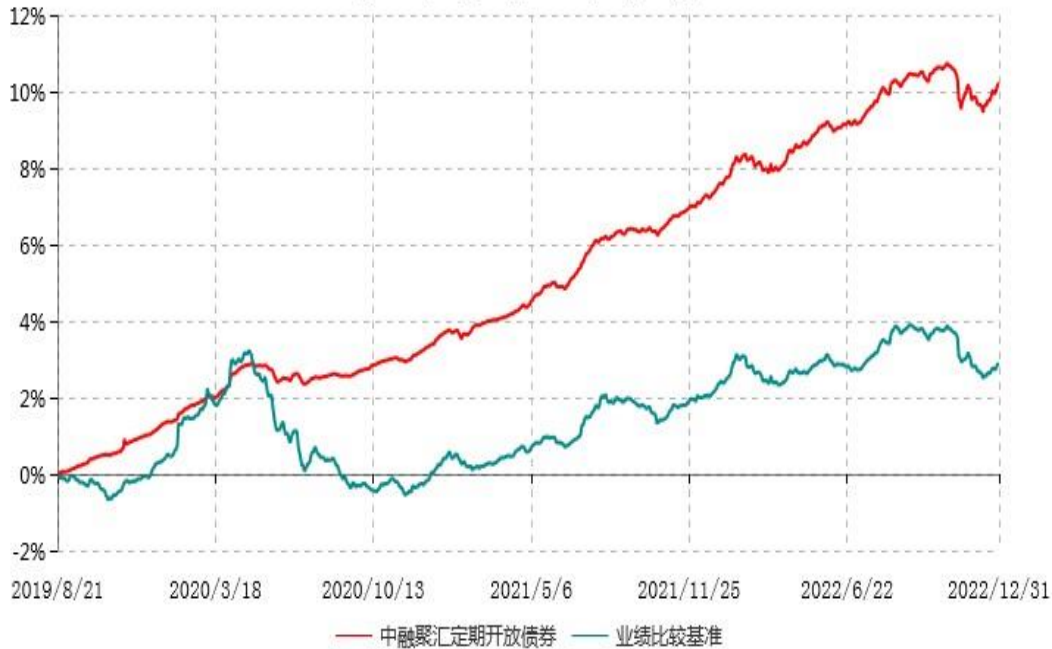
中融聚汇3个月定期开放债券型发起式证券投资基金累计净值增长率与业绩比较基准收益率历史走势对比图 (2019年08月21日-2022年12月31日)

注：按基金合同和招募说明书的约定，本基金自基金合同生效日起6个月内为建仓期，建仓期结束时本基金的各项投资比例符合基金合同的有关约定。